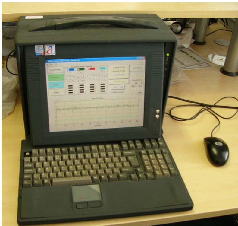
Obr.1 Měřicí počítač

karty, které jsou osazeny v samostatném šasi CompactDAQ a s PC jsou propojeny pomocí USB sběrnice. Hlavní karty se používají ke snímání vlastního zpětného trakčního proudu a je vyžadována vysoká přesnost záznamu. Dané karty mají 8 a 4 kanály s 24 bitovými převodníky, což poskytuje potřebný dynamický rozsah, a až 100kHz vzorkovací frekvencí, která je více než dostatečná vzhledem k relativně nízkým zájmovým kmitočtům, ovšem nutná pro záznam krátkodobých jevů. Pomocné karty přibýly později kvůli možnosti záznamu pomocných veličin, jako např. rychlost nebo točivý moment. Ty stačí snímat s mnohem nižší frekvencí, aby se snížila velikost datového souboru, která se už i tak pohybuje ve stovkách MB při záznamu jediné jízdy. Toto vybavení bylo zvoleno jako optimální varianta, splňující dané požadavky vzhledem na náročnost prostředí – vibrace a omezený prostor na vozidle, cenovou dostupnost a flexibilitu změn funkčnosti či hardwaru.